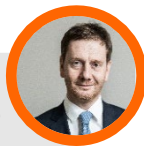
Michael Kretschmer Ministerpräsident Freistaat Sachsen

Gemeinsam ermöglichen wir weiterführenden Schulen die Projekte „City4Future – Entwickle deine klimafreundliche Stadt der Zukunft!“ und „IT2School – Gemeinsam IT entdecken“ .